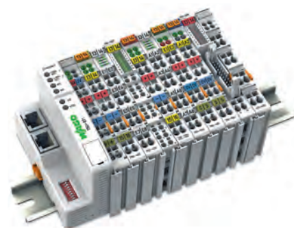
Ethernet Knoten (oben) und programmierbarer Feldbuscontroller (unten). Darstellung: WAGO