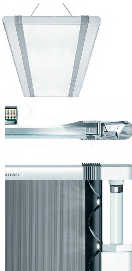
Hybridleuchte (oben) und Detailansicht (unten).

Neben der Elektroinstallation für Gebäudeautomation, Netzwerktechnik und Beleuchtung führt die Firma Oelkers auch die Brandmeldetechnik sowie den Blitzschutz aus.